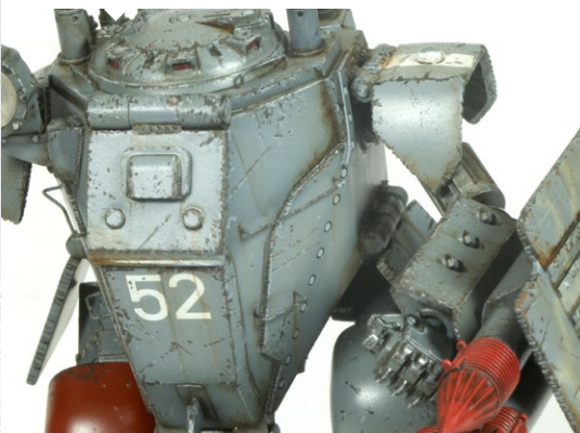
Other example of use. Otro ejemplo de aplicación.