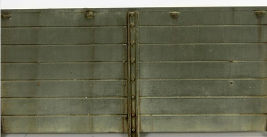
The final result / Resultado final

Una vez que el producto se seque, desliza suavemente un pincel húmedo, verticalmente de arriba a abajo, fundiendo y suavizando los efectos.