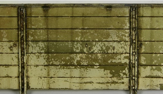
Final result. / Resultado final.

Once the product has set for 10-15 minutes, use the moistened brush to blend in the streaking grime. Una vez que el producto haya secado durante 10-15 minutos usa el pincel humedecido para fundir y suavizar la suciedad.